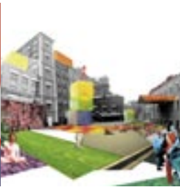
trans-struktura-express Team Russia